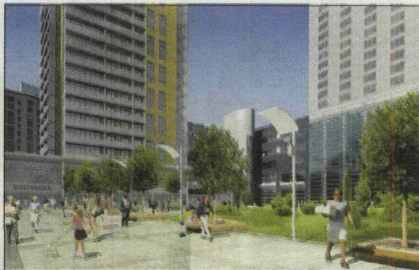
Budowa apartamentów przy Hiltonie ruszyła niedawno

Trudności nie odstraszały jednak deweloperów od snucia ambitnych planów. Wieżowcowy optymizm studzą za to eksperci. - Należy z roz-