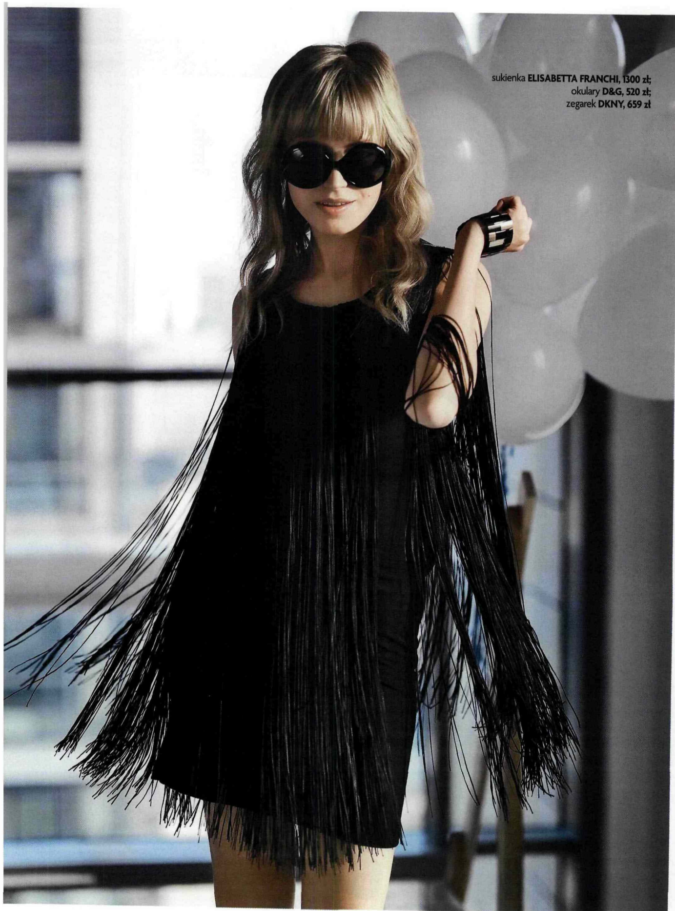
sukienka ELISABETTA FRANCHI , 1300 zł; okulary D&G , 520 zł; zegarek DKNY , 659 zł