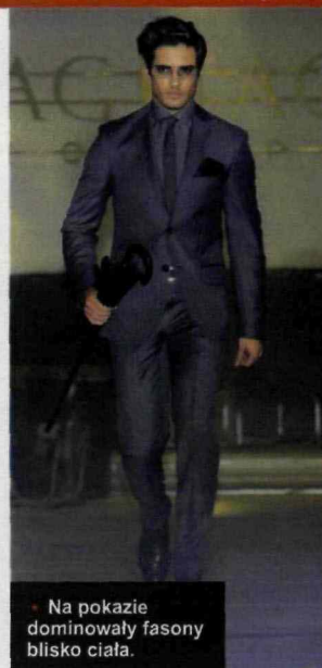
• Na pokazie dominowały fasony blisko ciała.

SUKCES Całą kolekcję można uznać za bardzo udaną. Nam najbardziej podobały się zestawy marynarek z przetartymi dżinsami oraz klasyczne garnitury z welen w kratę.